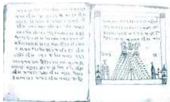
Manuscris nr. 13, Cartea I, Cap. VII pag. 25-26 și 26-28 (48-51)