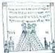
Manuscris nr. 13, Cartea I, Cap. VII pag. 25-26